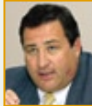
Jörg Stocker, Kommandant Bahnpolizei SBB 2002–2008